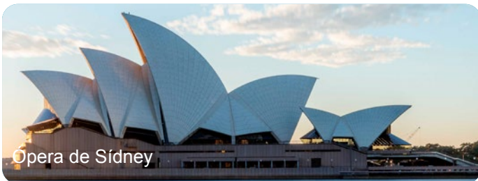
Ópera de Sídney

Llegada a Sídney por la noche, asistencia en el aeropuerto y traslado al hotel. Alojamiento en hotel de 5*.